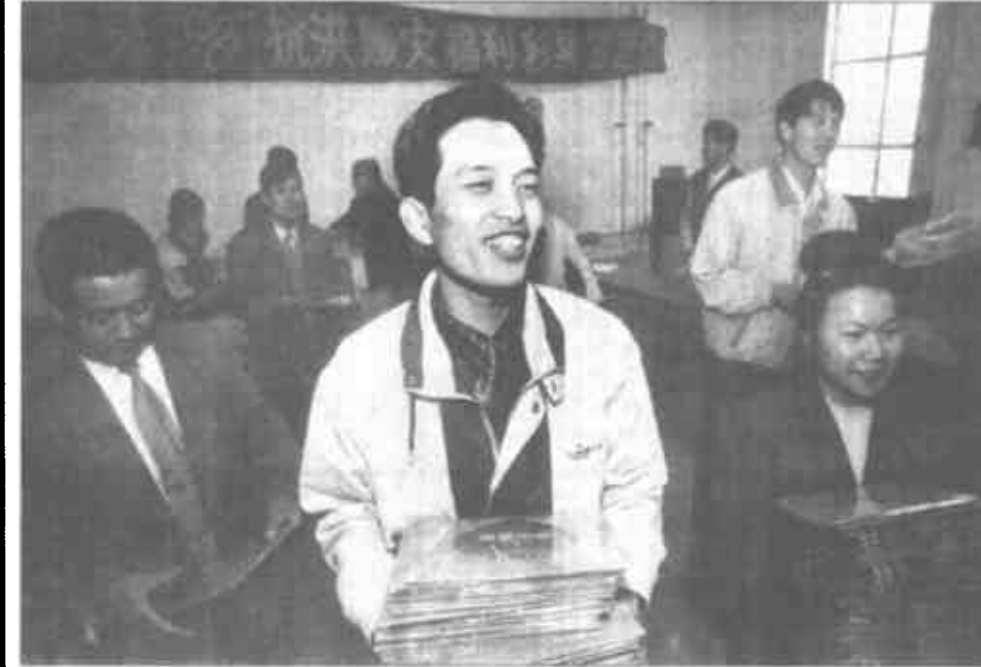
旨在动员广大人民群众发扬中华民族“一方有难，八方支援”的优良传统，弘扬“抗洪精神”和社会主义人道主义精神，筹集救灾资金，资助灾区人民恢复生产，重建家园的“98抗洪传统型福利彩票”，于1月20日在我市开始销售。我市党政机关及企事业单位的干部职工踊跃认购，这不，20日上午刚开了动员大会，下午市人事局、审计局等单位就已到市福利局来认购彩票，他们表示，要为灾区人民献一份爱心。

观念，加入到农业建设队伍中去，准备大显身手。 蔬菜行情上了网 为了便分种植、经营的农户适应市场经济的需求，广饶县坚持生产与流通并重，他们十分重视蔬菜批发市场建设，重点规划建设了县城南蔬菜批发市场和西营蔬菜批发市场已初具规模，吸引了大批外地客户来广饶县组织蔬菜运销，在蔬菜大批量上市，销售旺季日交易额分别在100万元以上。 各乡镇也各显其能，西营乡印制了西营蔬菜宣传材料，在沈阳、哈尔滨、天津等城市建立了蔬菜直销点，去年4月份，他们到国家工商总局申请注册了“黄河口”牌商标，并加入了农业部菜篮子信息中心网络，实现了与全国大中型蔬菜生产基地联网。 大王镇专门成立了特菜销售公司，配备了运菜专用车，按外商要求印制了包装袋，对凯银特菜进行了绿色食品登记，向国家有关部门争取到了自营进出口经营权，并开通了国际互联网，公司还有自己的英、俄、日、韩翻译，在黑河、绥芬河、满洲里和北京、上海等城市设立了5个销售办事处，所生产的以色列优质西红柿主要销往俄罗斯、东北地区以及各大城市超市。